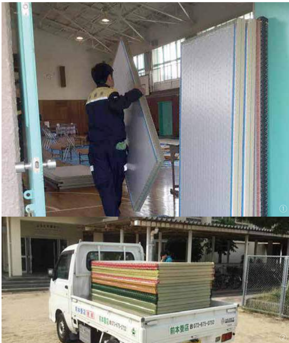
①高槻市の避難所へ畳を搬入。 ②避難所へ畳が到着した様子。

2018年7月18日に発生した「大阪北部地震」。19日にプロジェクトメンバーが現地を視察し、高槻市役所へプロジェクトについて説明に伺いました。既に防災協定を締結していたこと、防災訓練を共にしていたこともあって、情報のやりとり、活動をスムーズに行うことができました。