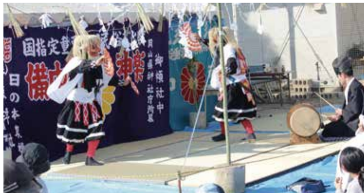
開催された復興神楽の様子

倉敷市で開催される『復興神楽』で使用する畳の相談を受け、避難所（※現時点で閉鎖されている避難所）にお届けした畳の再利用をご提案しました。