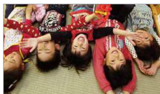
熊本地震時、避難所で遊ぶ子供たち。