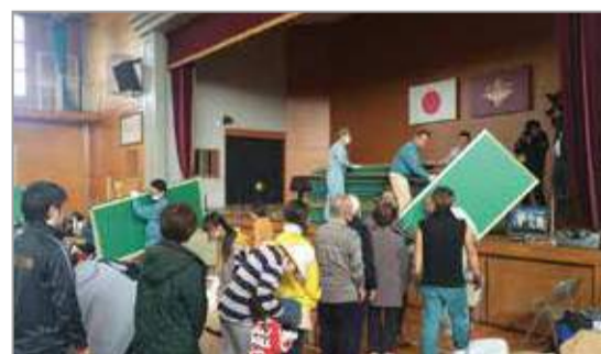
熊本地震時、益城町の避難所にて。